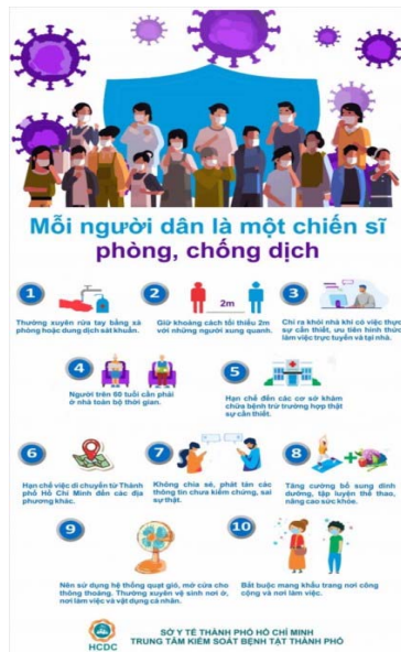
<그림 2> “모든 시민은 전염병 예방전선에 있는 군인”이라는 의미의 호찌민 의료부의 포스터

응웬쑤언푹 총리는 “모든 사업, 모든 시민, 모든 지역은 전염병을 예방하기 위한 요새가 되어야 한다”(Liberation 2020/04/06)라고 말하였다. 그러면서 그는 ‘전쟁’이라는 말을 강조하였는데, 이 말은 고난의 베트남 역사에서 늘 등장하던 수사로 사용되었다. 실제로 정부의 알림 문자에서도 “모든 시민은 전염병 예방 전선에 서 있는 군인(“Mỗi người dân là một chiến sỹ trên mặt trận phòng