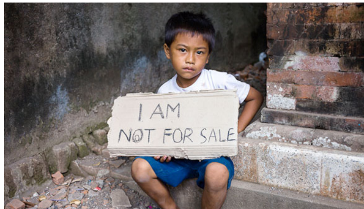
<그림 4> Tourism Concern의 고아원관광 근절 캠페인 이미지