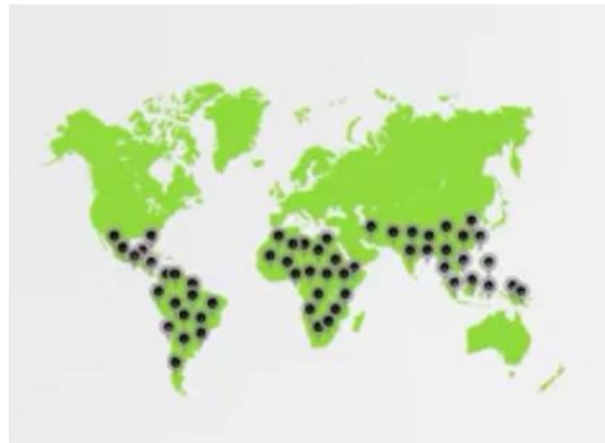
<그림 2> 전 세계 주요 고아원관광 지역