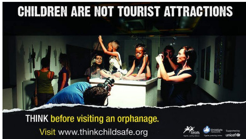
<그림 3> Friends International 캠페인 전단지 이미지