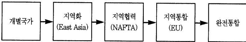
〈그림 1〉 지역협력의 발전과정과 사례

본 연구는 위와 같은 개념에 입각하여 ASEAN+3이 지역협력의 전 단계인 지역화가 충분히 이루어졌음을 주장하고자 한다. ASEAN+3의 경제적 상호 의존은 유럽과 북미 지역과 대등한 형태를 띠고 있으며, 정치적으로도 냉전의 종식과 동아시아 금융위기로 인해 협력의 분위기는 강화되고 있음을 밝히고자 한다. 지역화는 지역협력에 가장 기본적인 조건이다. 지역화가 충분히 조성되어 있지 않고는 지역협력을 유인(誘因)할만한 동력을 창출해 낼 수 없다. 즉, 경제적 이익이 발생하지 않는 지역협력은 무의미한 것일 수밖에 없다. 동아시아는 지역협력의 이익을 생성할 수 있는 충분한 지역화가 되어있음을 볼 수 있다. 문제는 이러한 지역화를 기초로 지역협력을 이끌어내는 구체적인 정책들이 부재하거나 관련 모델들이 쉽게 소멸되어 왔다는데 있다.