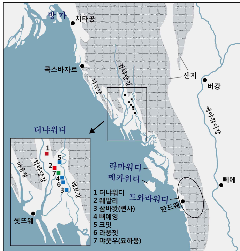
<그림 2> 여카잉 연안대의 세부구역도. 저자 작성.

적어도 17세기 중반까지로 볼 수 있는 전근대기의 여카잉 연안대는 위 <그림 2>와 같이 4개 혹은 5개의 하부구역으로 세분화될 수 있다(Charney 1999: 2-24; Gutman 1976: 4-5; Van Galen 2008: